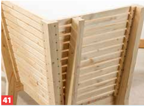
41 Bohren und senken Sie die Winkel und verschrauben Sie sie mit den Latten in beiden Ecken der Bank. Auch die Latten vorbohren!