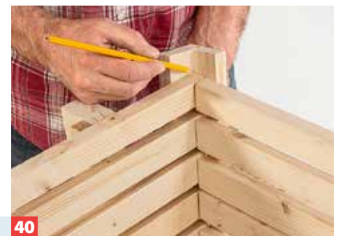
40 Auch diese Winkel mit etwas Übermaß herstellen; die Länge passen Sie unmittelbar an der Bank an.