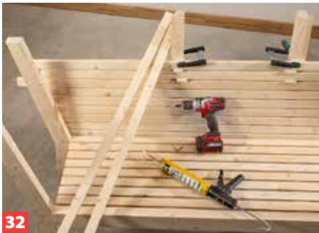
32 ... und verschrauben Sie die Rückenlatten mit etwas Überlänge zu beiden Seiten hin mit den Quadratleisten.