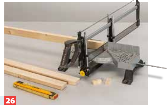
26 Anschließend längen Sie die Sitzlatten ab – die Kanten schneiden Sie parallel zum Winkel der Lehnenstützen leicht schräg zu.

Nur wenig Klebstoff ... ... an die Markierungen der ersten Latte auf den Quadratstäben geben.