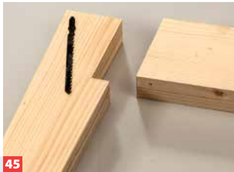
45 Den Bau des Tisches zeigen wir nur exemplarisch mit drei Fotos: Die Beine werden für die Querstreben ausgeklinkt. Der Rahmen ...