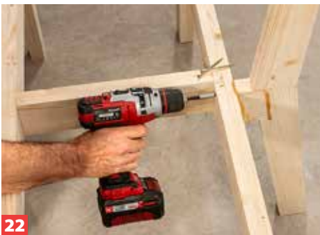
22 Anschließend verkleben und verschrauben Sie diese Bauteile senkrecht mit dem Sitzrahmen – leicht versetzt zu den Querriegeln.

Zwischenstand: Es fehlen nur noch die Latten der Sitzfläche und der Lehnen.