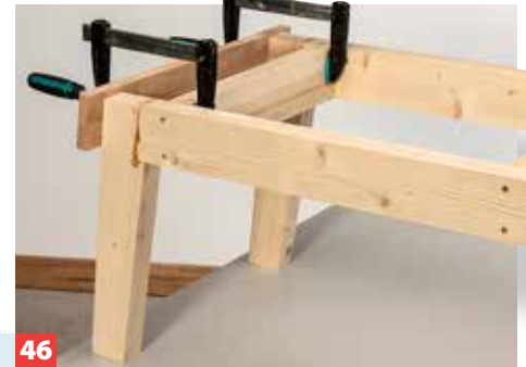
46 ... wird verklebt und (in Zapfensenkungen) verschraubt. Anschließend den Rahmen mit den Beinen verkleben und verdübeln.