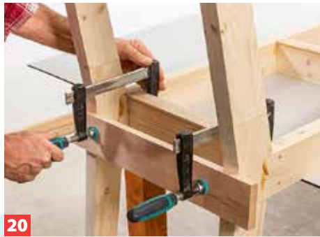
20 Bringen Sie die Stützen immer paarweise an und verpressen Sie sie mithilfe eines Querriegels (als Verleimhilfe) und zwei Zwingen.