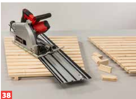
38 Dann demontieren Sie die Quadratstäbe und schneiden den jeweils hinteren Schrägverlauf der Latten sauber zu.