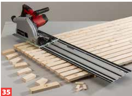
35 So können Sie das komplette hintere Lehnelement sauber mit der Tauch- bzw. Handkreissäge entlang einer Schiene zuschneiden.