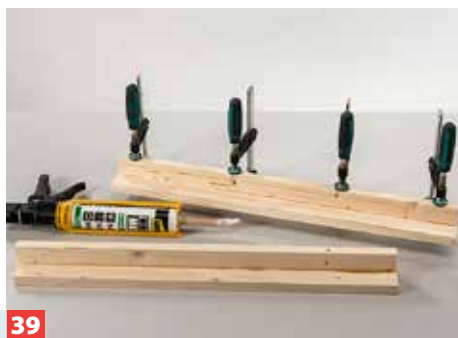
39 Zur Stabilisierung der Lattenstöße in den Ecken verkleben Sie zwei solcher Eckwinkel. Ausgetretenen Klebstoff entfernen.