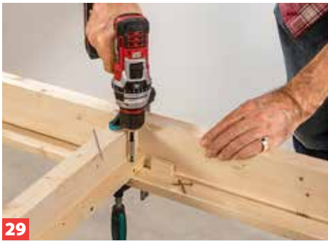
29 Nun schrauben Sie die Latte von unten durch die Quadratstäbe fest. Vorbohren! So folgt nun eine Latte nach der anderen.