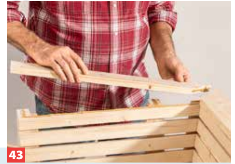
43 Die Blenden aufkleben und verschrauben. Auch hier sitzen die Schraubenköpfe vertieft in einer Zapfensenkung.