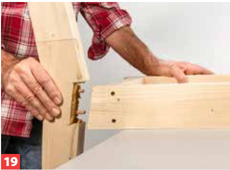
19 Nach dem Abbinden werden die vier seitlichen Stützen mit Holzdübeln und Holzklebstoff montiert.