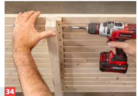
34 Anschließend lösen Sie die Schrauben, mit denen Sie die Quadratleisten an den hinteren Lehnenstützen befestigt haben.