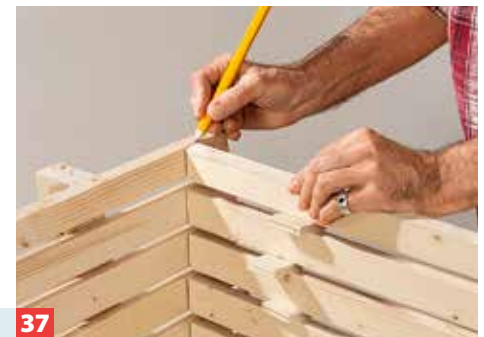
37 Die finale Länge der Latten markieren Sie entlang der Rückenlatten.