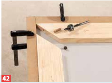
42 Den oberen Abschluss der Bank bilden auf Gehrung geschnittene Blenden, die auch die Stützen abdecken. Dübel in die Ecken setzen!