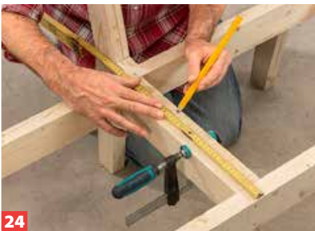
24 Mit der Sitzfläche haben wir begonnen. Spannen Sie einen Quadratstab gegen einen Querriegel und markieren darauf ...