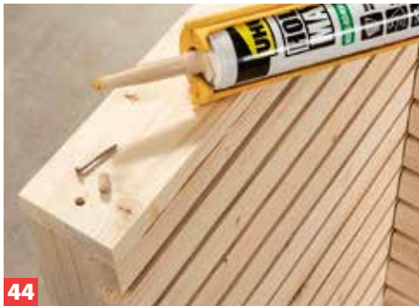
44 Die Schrauben im sichtbaren Bereich nun mit eingeklebten Dübelabschnitten abdecken. Bündig abschneiden und schleifen.