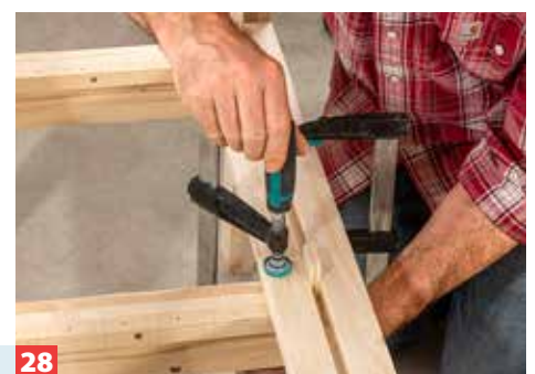
28 Platzieren Sie die Latte mithilfe von Abstandhaltern an der aufgespannten vorderen Latte und fixieren Sie sie mit Zwingen.