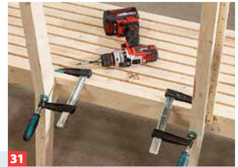
31 Danach geht es mit der Rückenlehne weiter. Hier liegen die gebohrten Quadratleisten außen an den hinteren Stützen. Verkleben ...