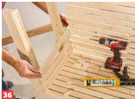
36 Genauso gehen Sie bei den Seitenlehnen vor: Quadratstäbe montieren und die Latten mit Überlänge fluchtend montieren.