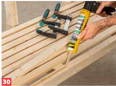
30 Erst wenn alle Sitzlatten montiert sind, kleben Sie auch die bislang nur aufgespannte vordere Latte auf den Längsrahmen.