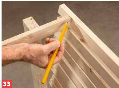
33 Sind alle Latten montiert, markieren Sie die Längen mithilfe einer Latte, die Sie über die seitlichen Lehnenpaare führen.