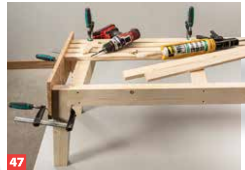
47 Die Latten der Tischfläche mit gebohrten/gesenkten Quadratstäben verkleben und verschrauben. Dann Dübelstopfen setzen.